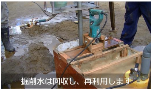
掘削水は回収し、再利用します